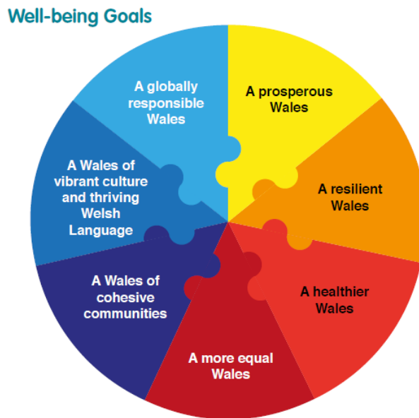
Ffigur 1: Nodau Llesiant Deddf Llesiant Cenedlaethau'r Dyfodol (Cymru)

Yn 2015, cyflwynwyd Deddf Llesiant Cenedlaethau'r Dyfodol (Cymru) (y cyfeirir ati yn y ddogfen hon fel 'Deddf LICD') gan Lywodraeth Cymru hefyd. Mae'r Ddeddf hon yn cyflwyno dyletswydd gyfreithiol ar wasanaethau cyhoeddus ledled Cymru i weithio gyda'i gilydd, gyda phobl Cymru, ar gyfer ein llesiant yn y dyfodol. Cyflwynir y ddyletswydd hon ar ffurf saith nod llesiant cenedlaethol, y mae'n rhaid i bob un ohonom gyfrannu at eu cyflawni.