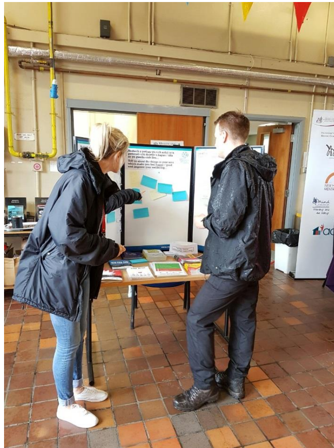
Ffigur 3: Ymgysylltu Cymunedol mewn digwyddiad elusennol gan y Maer a Gwasanaeth Tân ac Achub De Cymru a gynhaliwyd yn Abercynon